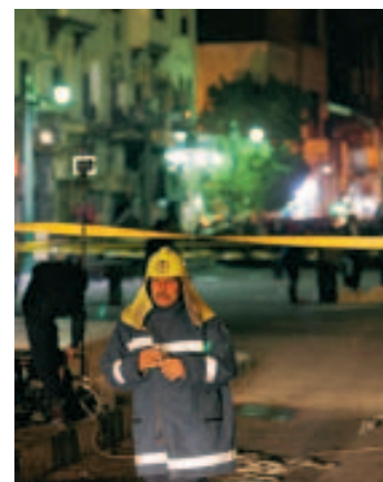
Deux bombes ont explosé.

Une touriste française a été tuée et 17 personnes ont été blessées, dont une dizaine de touristes, dans l'explosion d'un engin hier soir près d'un café du bazar de Khan el-Khalili, un quartier touristique du vieux Caire. La touriste est décédée à l'hôpital, alors que quatre des blessés se trouvaient ce dimanche soir encore dans un état critique. Parmi les blessés figurent onze Français, trois Allemands et trois Egyptiens.